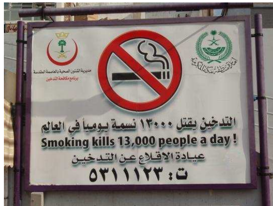
Anti-Tabak-Werbung nahe Mekka, Saudi-Arabien.

tötet, der wird sein Messer in seiner Hand tragen und es im Höllenfeuer auf ewig in seinen Bauch führen und darin in aller Ewigkeit bleiben. 6